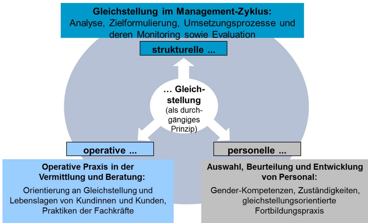
Abbildung 2: Der Referenzrahmen