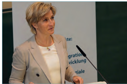
Ministerin Dr. Nicole Hoffmeister-Kraut

Ausführlich würdigte die Ministerin für Wirtschaft, Arbeit und Wohnungsbau Baden-Württemberg, Dr. Nicole Hoffmeister-Kraut, die langjährige Tätigkeit des IAW. Das Institut sei fest in der baden-württembergischen Forschungslandschaft